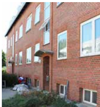
Rødovre Boligselskab, Rødovre