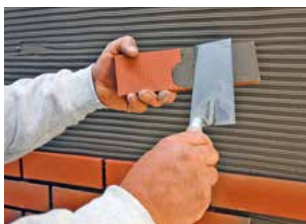
StoBrick klæbes direkte på grundpuds og fuges