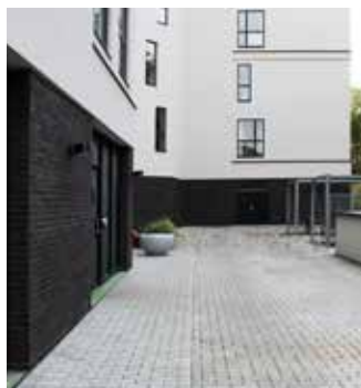
Ok-huset Lotte, Frederiksberg

Renovering, isolering og design med mange muligheder